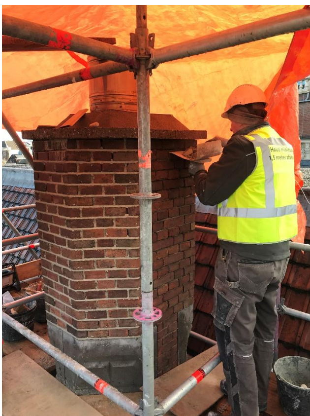
Figuur 2 Herstellen van het voegwerk

Binnenin het Zusterhuis zijn diverse scheuren in het metselwerk hersteld en bleken enkele onderdelen dusdanig slecht dat deze (met kunsthars aangegoten) aangeheeld moesten worden. Zo zijn ze weer sterk genoeg voor de toekomst.