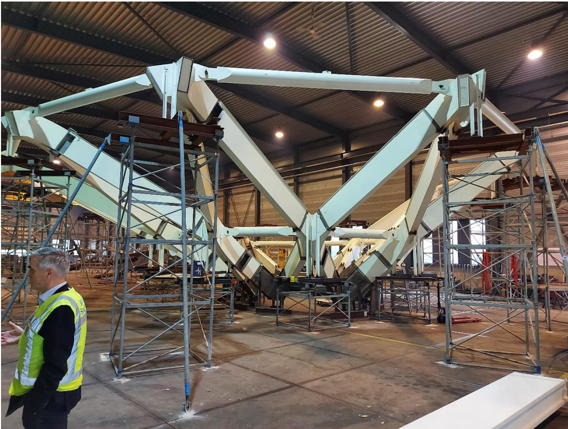
Figuur 4 De fabriek van Buiting Staalbouw in Almelo waar de boom van de atriumkap is geproduceerd.

De boom van de atriumkap is met zijn twaalf kolommen een bijzonder architectonisch element in het atrium dat de glaskap mede ondersteunt. De boom en de atriumkap zijn constructief een heel uitdagend en complex project. In deze 'boom' zit een trap zodat je via de boom ook naar de verdiepingen kunt lopen, maar ook naar de ruime bordessen met werk- en studieplekken. Daarnaast vindt de afvoer van hemelwater via figuurlijke 'lianen' in de atriumboom plaats.