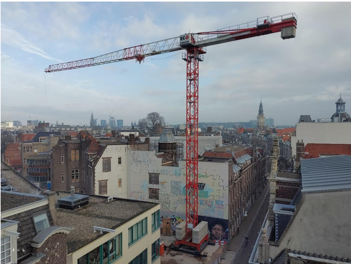
Figuur 1 De torenkraan op de hoek aan de Vendelstraat

Zoals u vast gemerkt heeft, staat de torenkraan op zijn plek. De kraan is op maandag 24 januari jl. gestart met draaien voor de aanvoer van het steigermateriaal en de opbouw daarvan in de Nieuwe Doelenstraat. Het draaien van de kraan zal u waarschijnlijk wel opvallen, maar de geluidsoverlast is zeer beperkt.