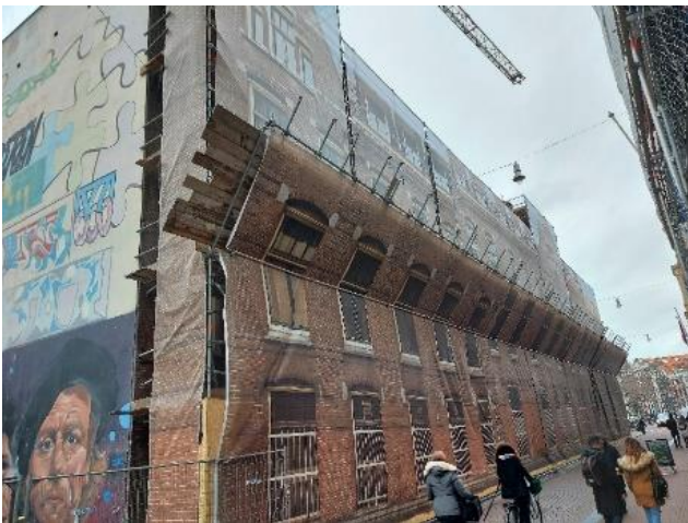
Foto: Steigerdoek aan de Nieuwe Doelenstraat

Recent is de steiger aan de Nieuwe Doelenstraat opgebouwd en in gebruik genomen. Deze gevel is gereinigd, waarna de aannemer het metselwerk en voegwerk gaat herstellen. Om de overlast in de vorm van geluid, stof en transport zoveel mogelijk te verminderen is een speciaal steigerdoek toegepast dat 80% van het vrijkomende stof tegenhoudt. Daarnaast wordt het puin opgevangen en reduceert dit doek het geluid.