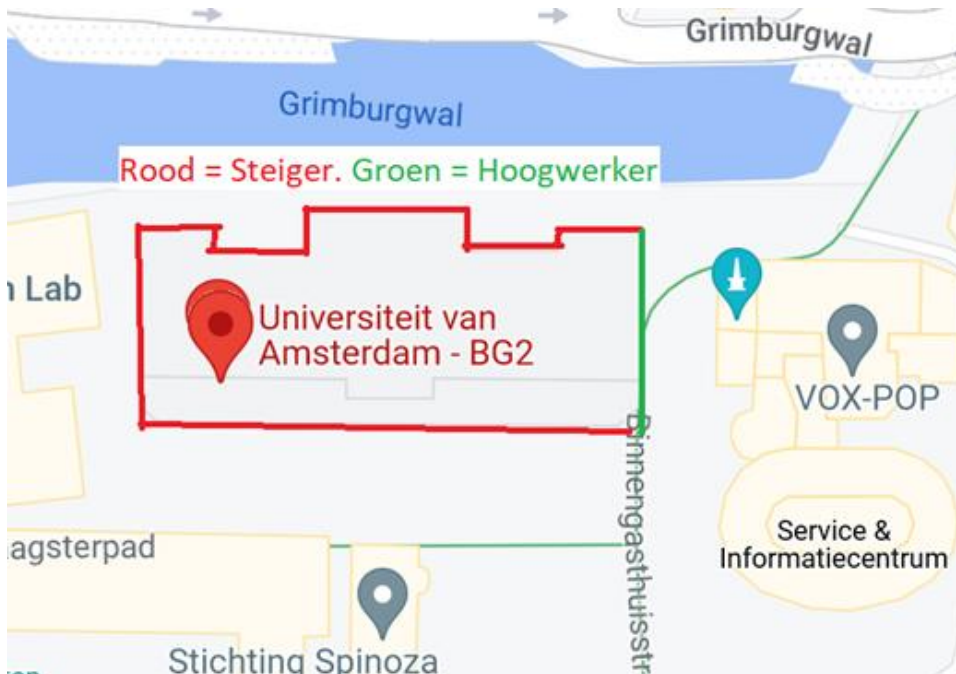
Afbeelding 1: Steigeropbouw BG2