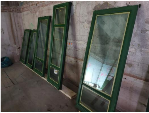
Figuur: Herstelde ramen