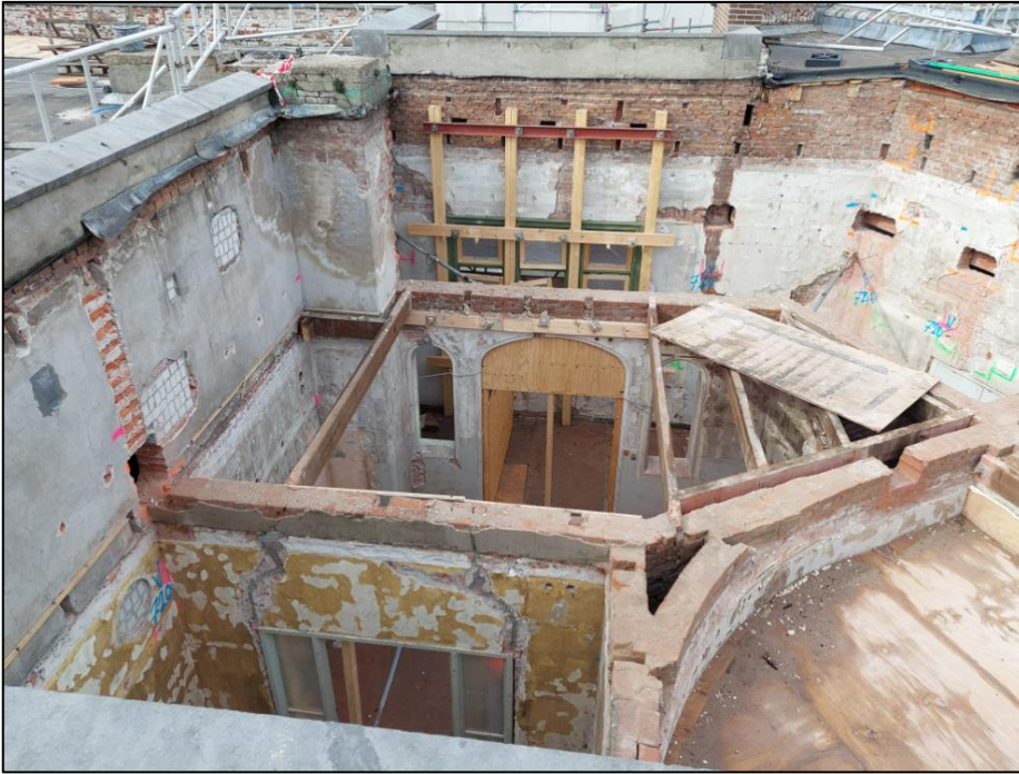
Figuur : Sloopwerkzaamheden ter plaats van de 'oksel'

staalbetonvloer maken. Hier boven op komt de staalconstructie voor de nieuwe techniekruimte.