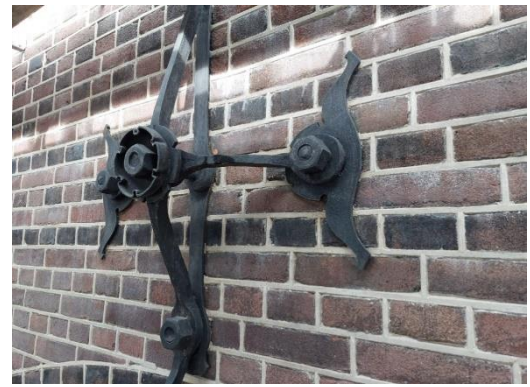
Figuur: Herstelde gevel met muraankers

Enkele werkzaamheden die nog plaats zullen vinden aan de gevels van fase 6+7 : aanbrengen voegwerk, terugplaatsen van ramen ,aflakken ramen. Vervolgens wordt fase 8 nog onderhanden genomen met onder andere het voegwerk.