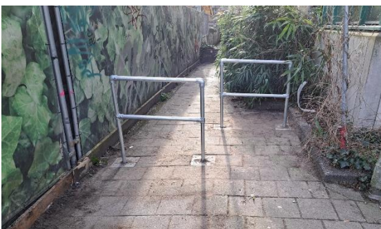
Foto: de nieuwe hekjes in de Binnengasthuisstraat

In de Binnengasthuisstraat zijn vorige week in overleg met buurtbewoners door de gemeente hekjes geplaatst om de overlast van fietsers in de straat te voorkomen.